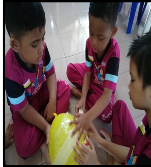
Kanak-kanak membalut permukaan belon menggunakan masking tape