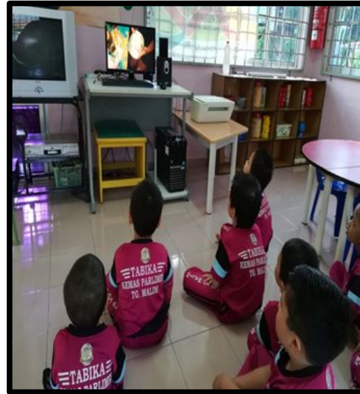
Kanak-kanak menonton video cara membina Helmet Angkasa